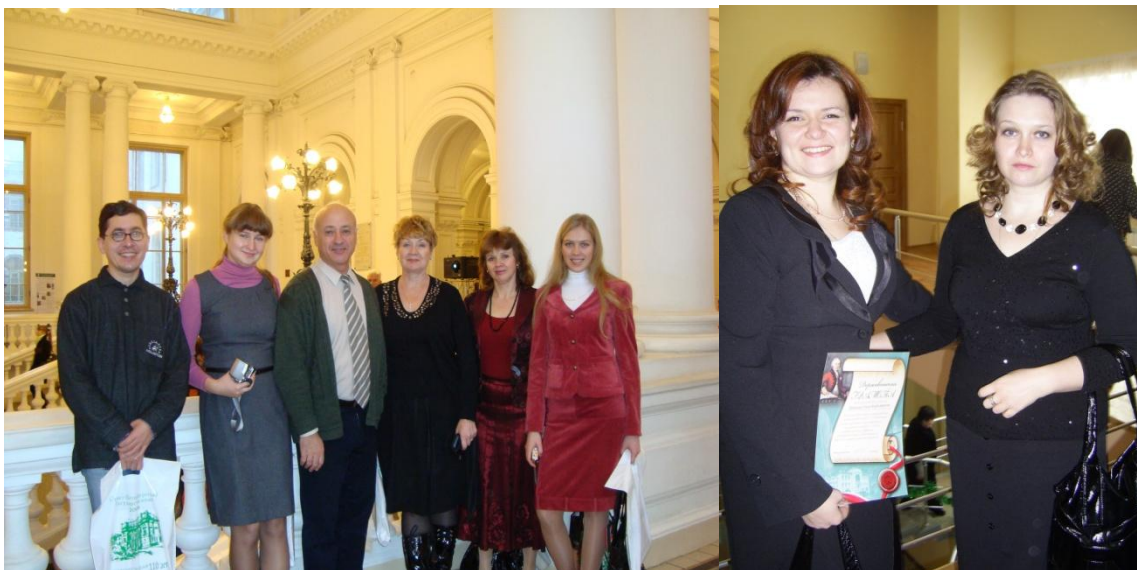
Делегация лаборатории на форуме «Инновации: наука, образование, бизнес» в Санкт-Петербурге

Установились связи с ведущими научными и образовательными учреждениями (Институтом содержания и методов обучения РАО, Санкт-Петербургским государственным политехническим университетом, Нижегородским государственным лингвистическим университетом, Томским государственным университетом и др.), с крупнейшими издательствами, наводятся мосты сотрудничества с коллегами из Белоруссии, США, Кубы и Мексики.